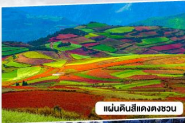
แผ่นดินสีแดงตงชวณ