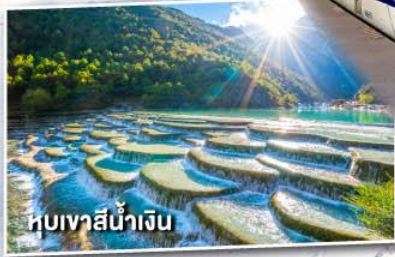
หุบเขาสีน้ำเงิน