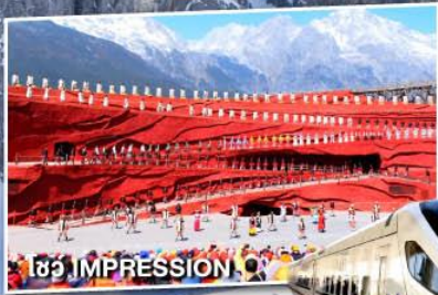
โชว์ IMPRESSION O