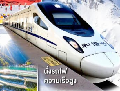
นั่งรถไฟ ความเร็วสูง