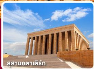
สุสานอคาเดิร์ก