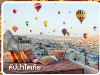
คัปปาโดเกีย