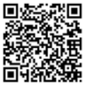
Photo Requirements for Chinese Visa Application