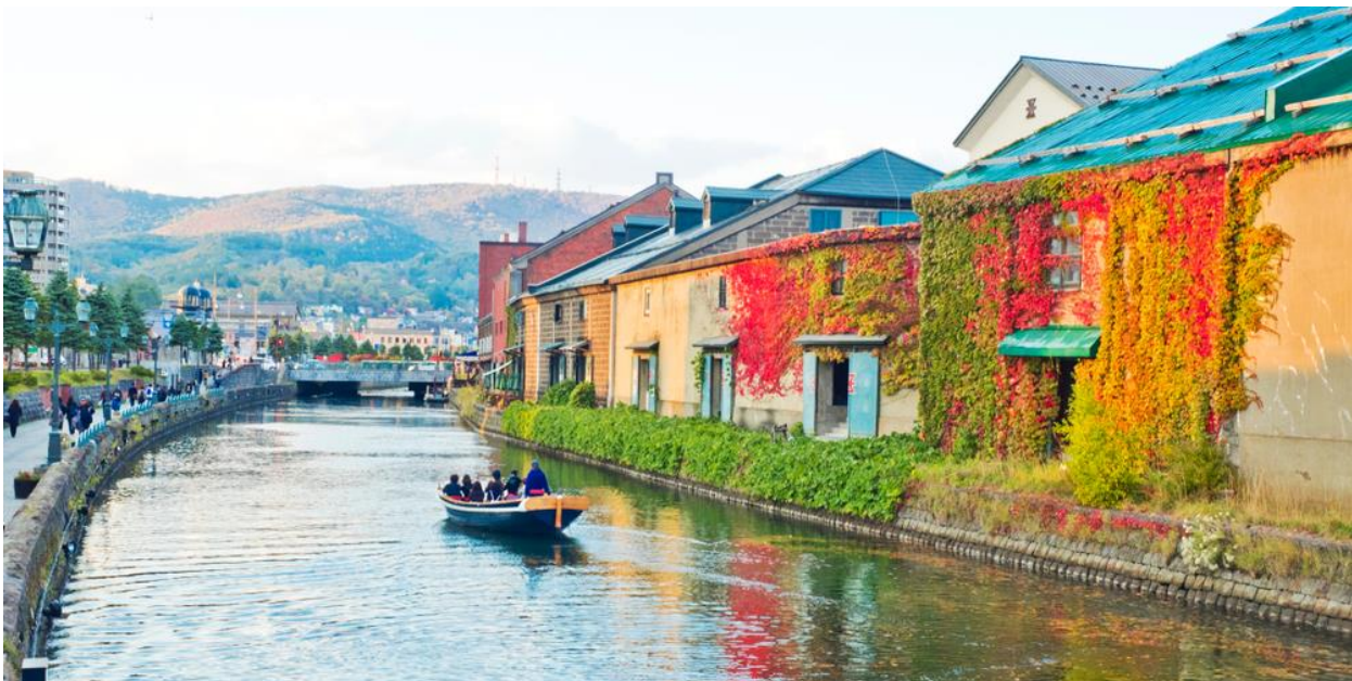
เที่ยง บริการอาหาร ณ ภัตตาคาร

นำทุกท่านต่อไปยัง เมืองโอตารุ โอตารุเป็นเมืองที่สำคัญสำหรับซัปโปโร และบางส่วนของเมืองตั้งอยู่บนที่ลาดต่ำของภูเขาเท็งงุ ซึ่งเป็นแหล่งสกีและกีฬาฤดูหนาวที่มีชื่อเสียง คลองโอตารุ หรือ โอตารุอุโนะ มีความยาว 1.5 กิโลเมตร ถือเป็นสัญลักษณ์ของเมืองโอตารุ โดยมีโกดังเก่าบริเวณโดยรอบปรับปรุงเป็นร้านอาหารเรียงรายอยู่บรรยากาศสุดแสนโรแมนติก คลองแห่งนี้สร้างเมื่อปี 1923 โดยสร้างขึ้นจากการถมทะเล เพื่อใช้สำหรับเป็นเส้นทางขนถ่ายสินค้ามาเก็บไว้ที่โกดัง แต่ภายหลังได้เลิกใช้และมีการถมคลองครั้งหนึ่งเพื่อทำถนนหลวงสาย 17 แล้วเหลืออีกครึ่งหนึ่งไว้เป็นสถานที่ท่องเที่ยว มีการสร้างถนนเรียบคลองด้วยอิฐแดงเป็นทางเดินเท้ากว้างประมาณ 2 เมตร